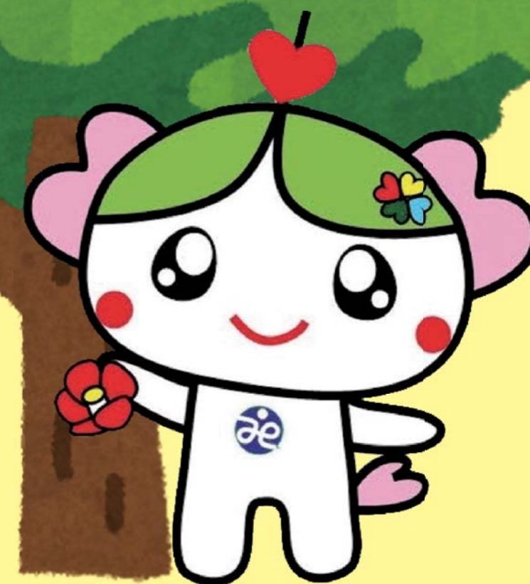
垂井町社会福祉協議会マスコットキャラクター“るいちゃん”